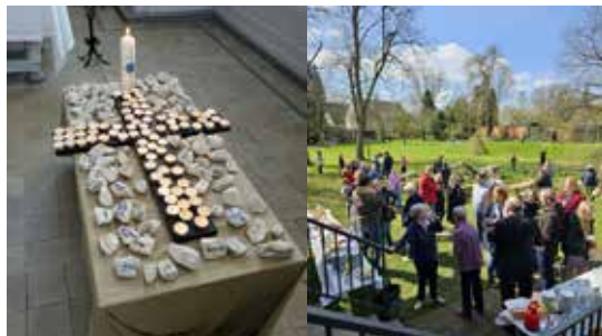
Ostersonntag Familiengottesdienst und Osterfrühstück