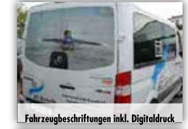
Fahrzeugbeschriftungen inkl. Digitaldruck