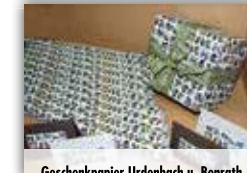
Geschenkpapier Urdenbach u. Benrath