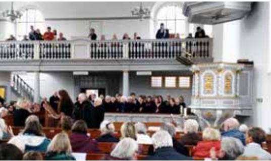
Passionsmusik am Karfreitag