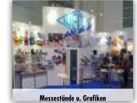
Messestände u. Grafiken

W. Stolz u. Partner GmbH Heinrich-Opladen-Str. 4 • 40593 Düsseldorf-Urdenbach